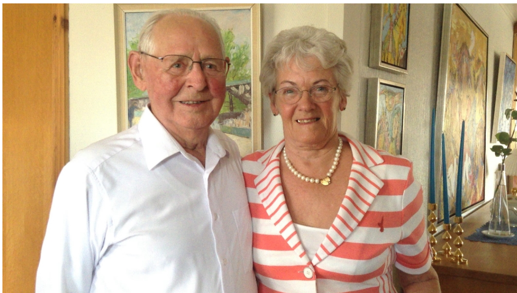
Rund fødselsdag i april 2013